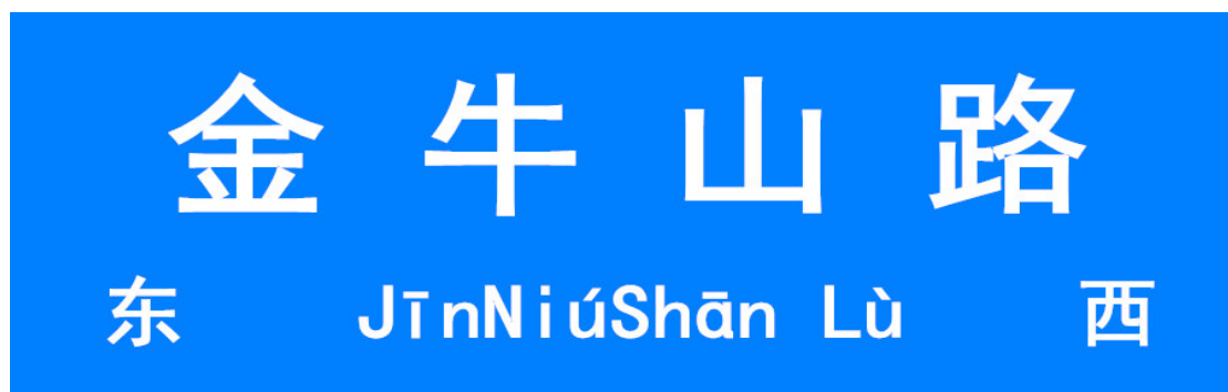
东西走向路（街、巷）地名标识标志版面示例